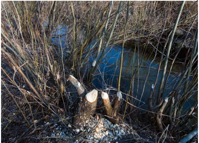
Żerowisko bobrów (na kanale Młynówka)

najliczniej nad Jeziorem Żywieckim - głównie na tzw. Ptasiej Wyspie oraz w ujściu potoku Moszczanka, a także w potoku Łazki w Rychwałdzie oraz potoku Lubra w Gilowicach. Obserwowano je również w wielu innych miejscach, np.: na Sole i Sopotni Wielkiej, na potoku Cięcinka i Kocierzanka, w kanale Młynówka w Węgierskiej Górcie oraz na stawach w Żywcu Moszczanicy. Ogółem liczebność populacji na Żywiecczyźnie ocenia się na ok. 40-50 osobników. Bobry znane są ze swoich zdolności inżynierskich. Konstruują tamy na ciekach wodnych, rozbudowane sieci kanałów, a także schronienia w postaci żeremi. Na Żywiecczyźnie za kryjówki służą im również nory ziemne. Gody bobrów są bardzo rozciągnięte w czasie, trwają od grudnia do maja, z największą intensywnością