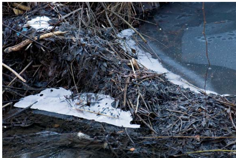
Żerowisko bobrów („Ptasia Wyspa”)

w styczniu. Młode przychodzą na świat od kwietnia do sierpnia, jednak najczęściej w maju lub czerwcu, po ciąży trwającej ok. 107 dni. W miocie rodzi się od 1 do 6 młodych, zazwyczaj 2-3. Dojrzałość płciową osiągną w drugim roku życia. Bobry są typowymi roślinożercami. Zjadają korę, liście, gałązki, korzenie, kłącza i bulwy niemal wszystkich roślin drzewiastych i zielnych rosnących nad brzegami wód, a także roślinność wodną. Zazwyczaj w ich diecie przeważają krzewy i drzewa, najczęściej wierzby i osiki. Znana jest nadzwyczajna zdolność bobrów do obalania drzew, nawet o średnicy pnia wynoszącej ok. 70 cm. Bobry są objęte w Polsce częściową ochroną gatunkową. Są one również chronione postanowieniami Dyrektywy Siedliskowej Unii Europejskiej. Jego występowanie jest podstawą tworzenia Specjalnych Obszarów Ochrony w ramach europejskiej sieci obszarów chronionych Natura 2000.