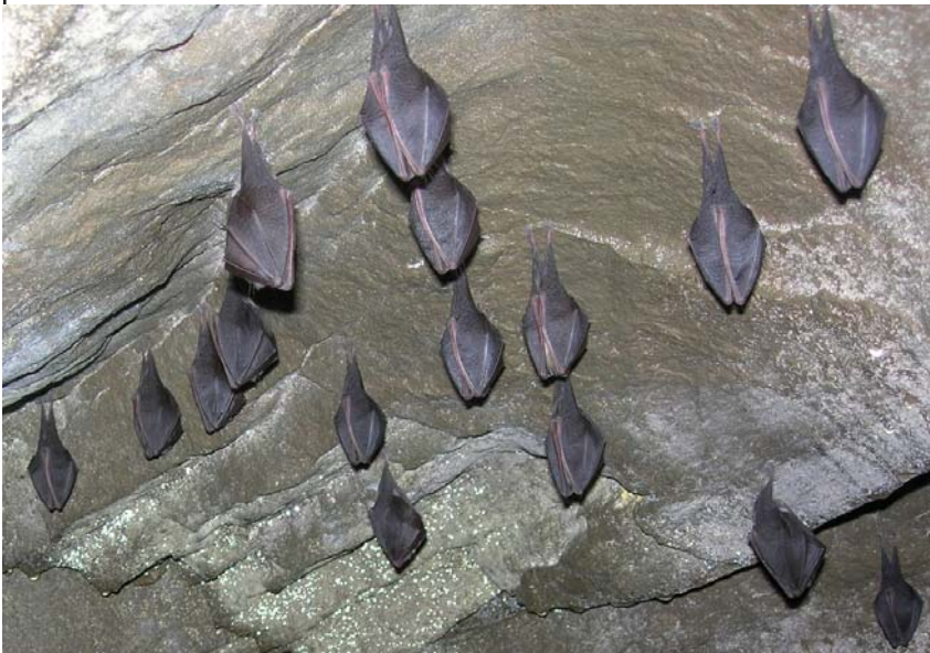
Podkowiec mały (kolonia)

Podkowiec mały Rhinolophus hipposideros . Niewielki, szaro umaszczone nietoperz, z charakterystyczną naroślą skórną w kształcie podkowy na pyszczku. Rejestrowany w całym powiecie żywieckim,