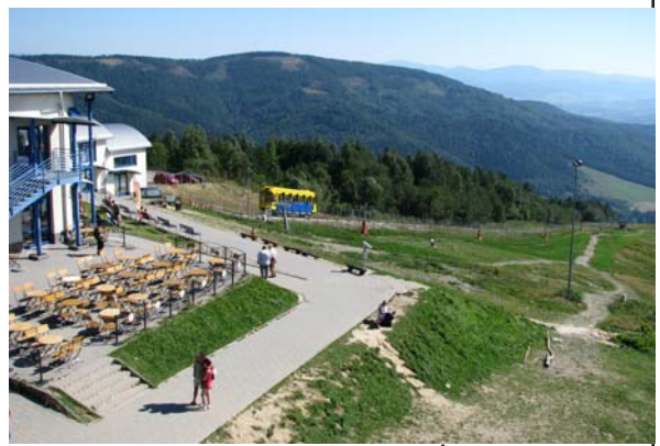
Obiekty turystyczne na górze Żar