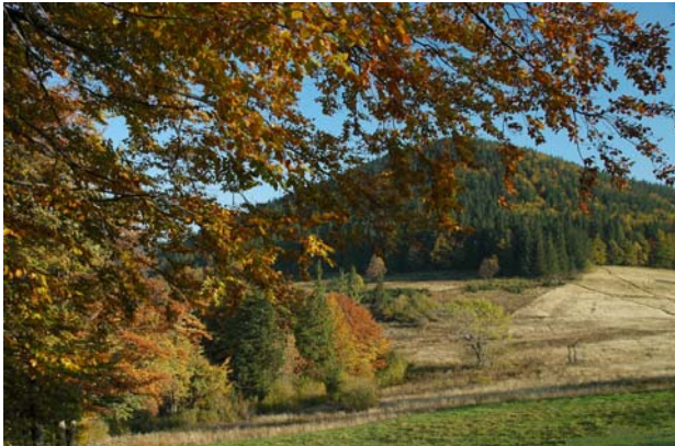
Widok na Banię z Przełęczy Przegibek

zachodnie stoki stromo opadają w kierunku początkowego odcinka dolinki potoku o tej samej nazwie.