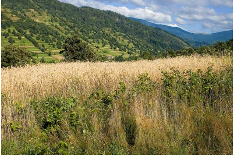
Widok na Abrahamów ze stoków Prusowa

Abramów (1084 m) - kulminacja w krótkim, bocznym grzbiecie odchodzącym na północ od pasma granicznego w rejonie Jaworzyny (1173 m). Na szczycie charakterystyczny "grzebień" boru świerkowego. Pomiędzy wierzchołkiem a graniczną Jaworzyną znajduje się łagodne siodło z widokową halą, przez którą przechodzi szlak turystyczny. Zalesione