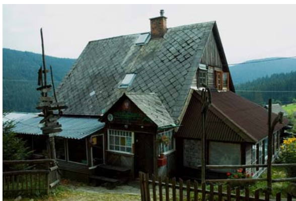
Schronisko „Chyz u Bac”