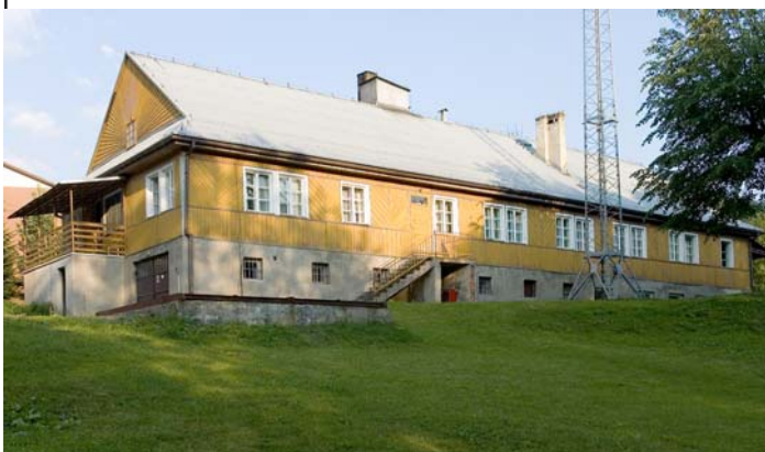
Schronisko PTSM Rycerka Kolonia