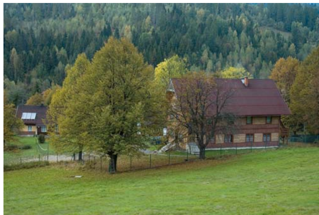
Schronisko PTSM Rajcza-Nickulina