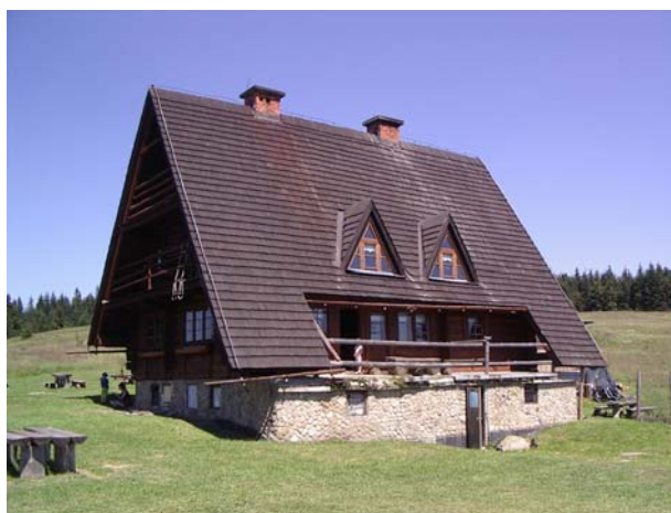
Bacówka PTTK na Krawcowym Wierchu