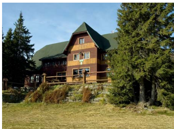
Schronisko PTTK na Hali Rysianka