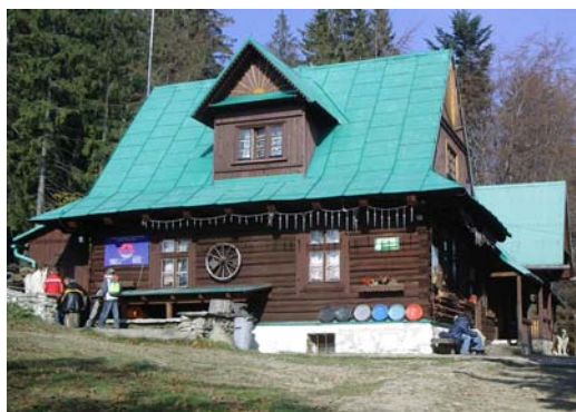
Schronisko PTTK na Przegibku