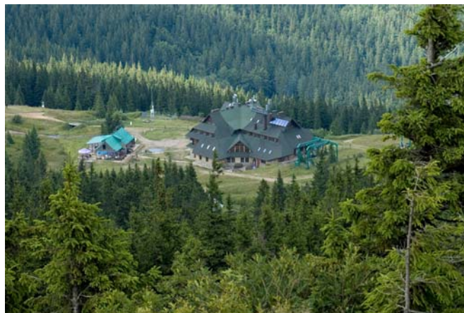
Schronisko PTTK na Hali Miziowej

Schronisko PTTK na Hali Boraczej (854 m n.p.m.)